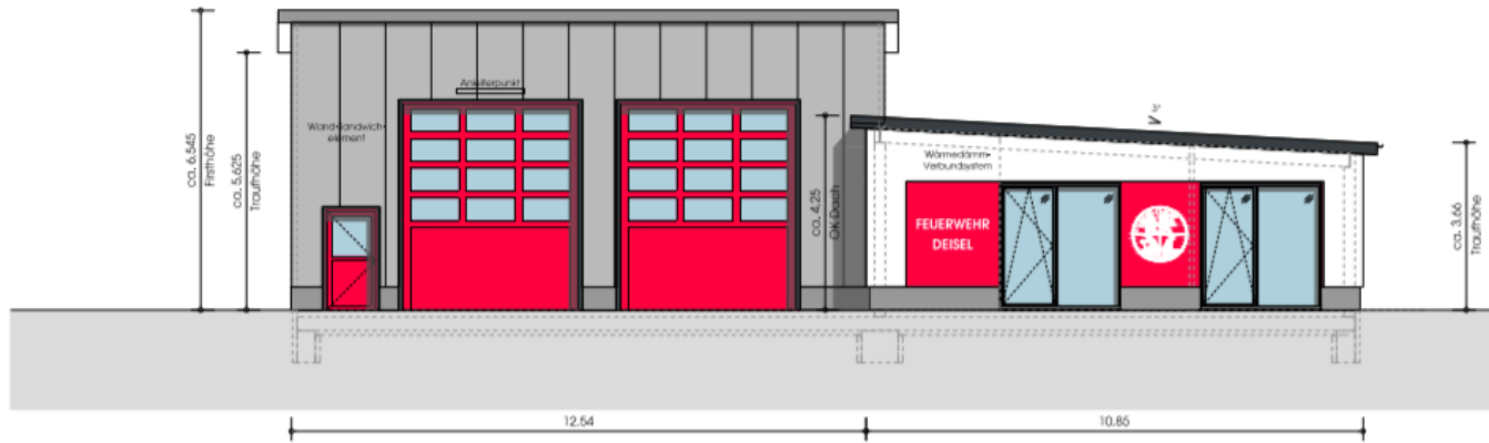
Ansicht Nord-Ost | Fahrzeughalle + Sozialbereich | M 1:100